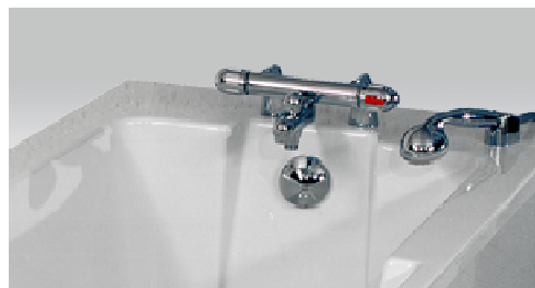
Mixer Termostatico con blocco antiscottatura